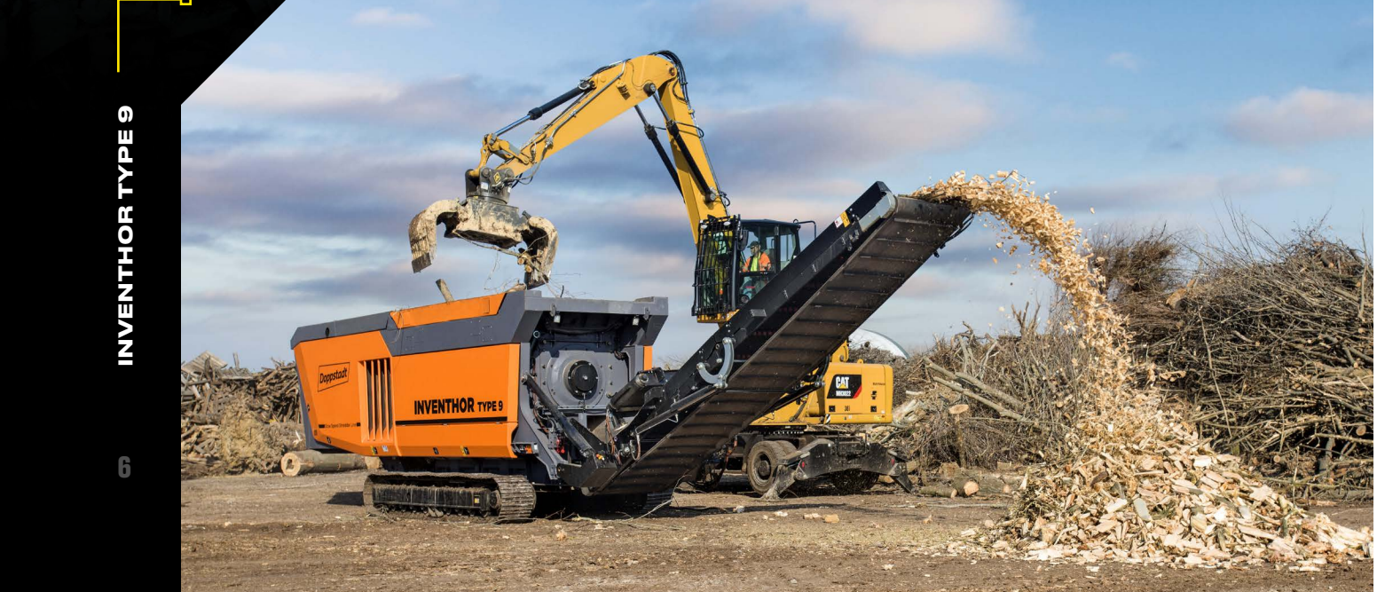
INVENTHOR TYPE 9